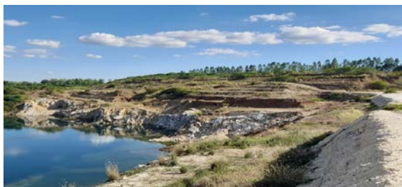
พื้นที่หน้าเหมืองประทานบัตรที่ 29537/15092