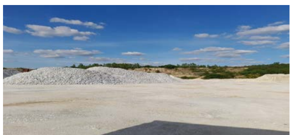
พื้นที่เก็บกองแร่ประทานบัตรที่ 29537/15092