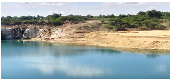
พื้นที่หน้าเหมืองประทานบัตรที่ 32253/16045