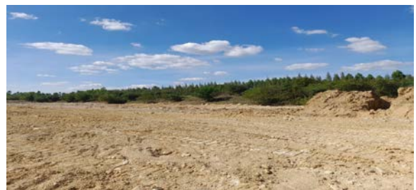
พื้นที่หน้าเหมืองประทานบัตรที่ 29536/15091