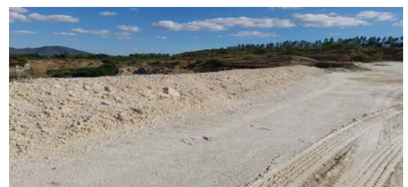
คันดินบริเวณขอบประทานบัตรที่ 29537/15092