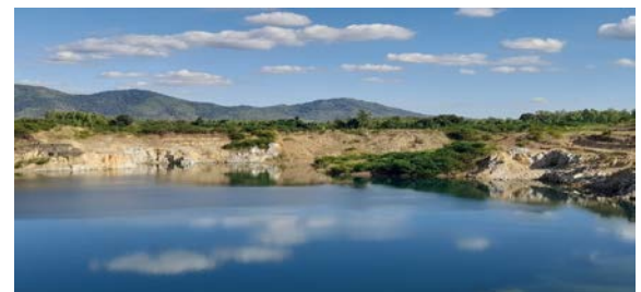
บ่อกักน้ำประทานบัตรที่ 29537/15092